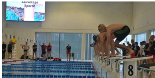
Photo de l'association des sauveteurs secouristes de Châteauneuf