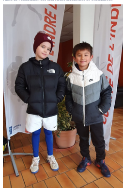
Photos du Comité de l'Indre de tennis