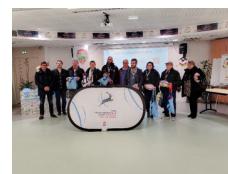
Photos du Comité Départemental de rugby de l'Indre