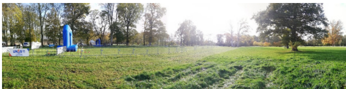
Photos de l'UNSS de l'Indre